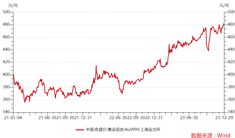
图 2021 年初至 2023 年末黄金价格趋势图

截至 2023 年年底，伦敦金（LBMA）午盘价达到 2,078.4 美元/盎司，创下年末收盘价新高，将黄金投资年回报率推至 15%。2023 年平均金价为 1,940.54 美元/盎司，同样创下历史新高，相比 2022 年上涨了 8%。2023 年，国际黄金价格在高位波动。12 月底，伦敦现货黄金年终价格为 2062.40 美元/盎司，较 2023 年初开盘价 1835.05 美元/盎司上涨 12.39%，年度均价 1940.54 美元/盎司，较上一年 1800.09 美元/盎司上涨 7.80%。上海黄金交易所 Au9999 黄金 12 月底收盘价 479.59 元/克，较 2023 年初开盘价上涨 16.69%，全年加权平均价格为 449.05 元/克，较上一年上涨 14.97%。